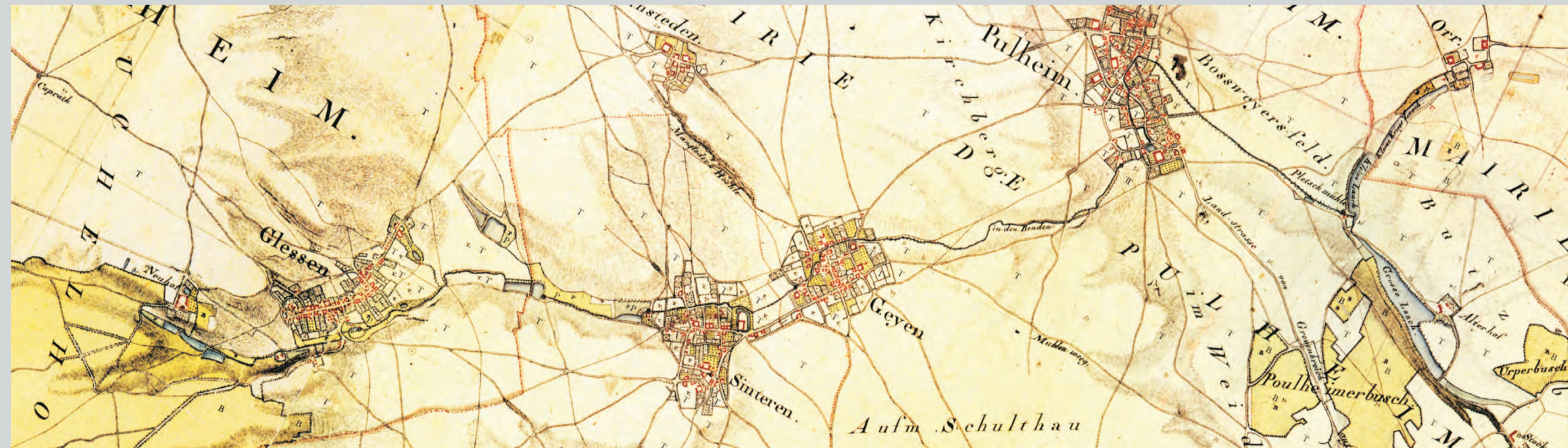
Topographische Aufnahme der Rheinlande durch Tranchot und v. Müffling (1803–1828) Zusammchnitt der Blätter 61 Hackenbroich, 70 Bergheim, 71 Lövenich

Vor der Erfindung von Dampfmaschine und Elektrizität nutzte der Mensch vor allem die Kraft von Wind und Wasser, um Maschinen zu betreiben. Vor allem Wassermühlen waren ein wichtiger Wirtschaftsfaktor in vorindustrieller Zeit. Dabei wurde nur Korn gemahlen. In Waldgebieten arbeiteten Sägemühlen, in Bergbaulandschaften wurden Erze zertrümmert ("Pochen") und Metalle geschmiedet ("Hammerwerke"). In der Jahrtausende alten Agrarlandschaft am Pulheimer Bach waren es vor allem Getreidemühlen. Es gab aber auch zeitweise Mahlgänge, um Öl aus ölhaltigen Feldfrüchten und Grütze aus Gerste zu gewinnen.