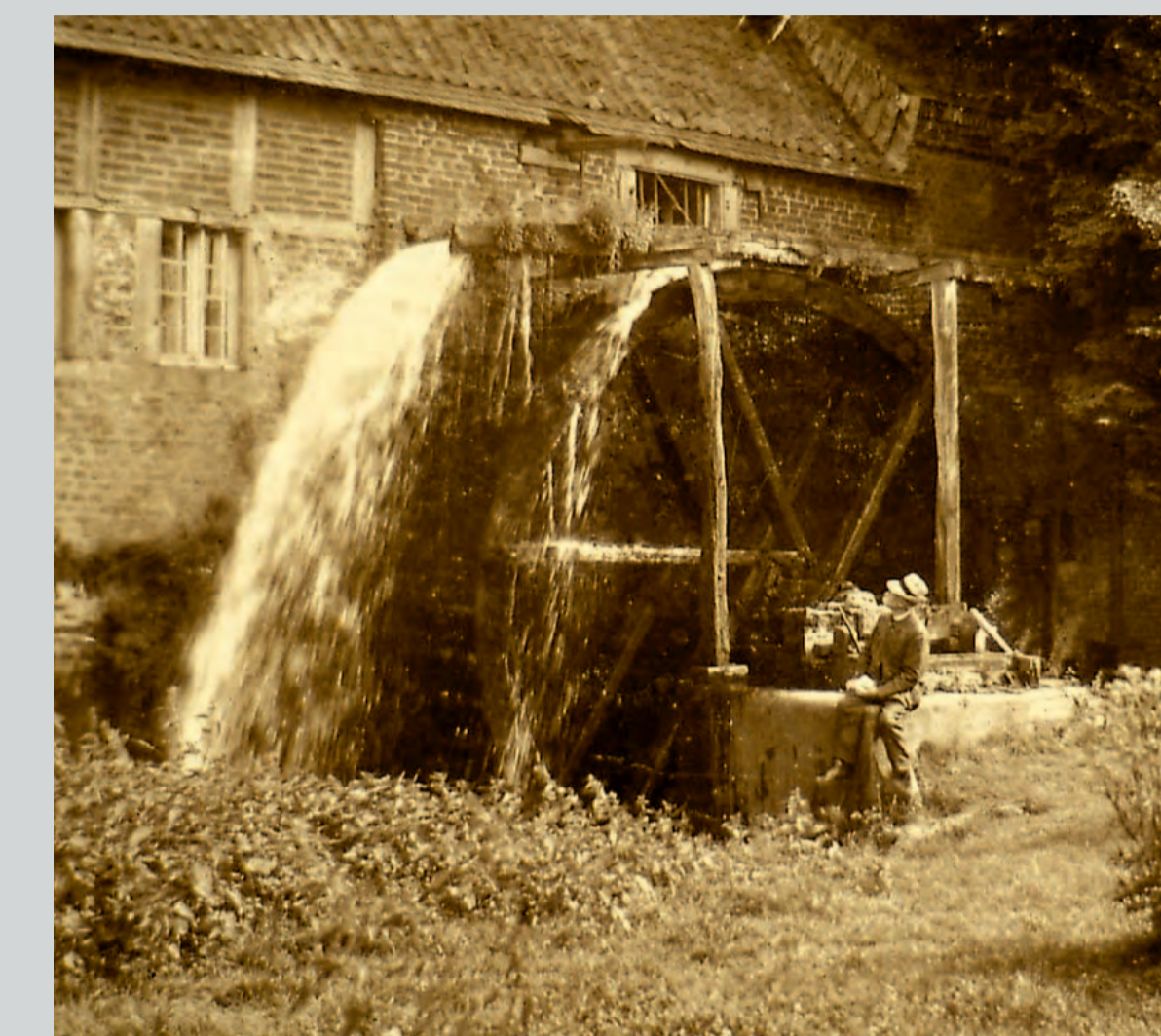
Oberschlächtige Sintherner Mühle Postkarte von 1928

Die meisten Teiche am Bach, oberhalb der Mühlen, dienen dagegen vor allem zur Bevorratung des Antriebswassers und wurden kontrolliert geöffnet, wenn ein Mahlgang anstand. Für einen durchgehenden Betrieb reichte die Wassermenge im Bach nicht aus.